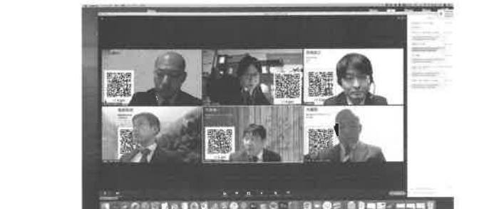
名刺交換アプリも使い意見交換

初めてのオンラインでの開催ということもあり、どのようにしたら会員同士が楽しく交流出来るのか、オンラインツールの特徴やメリットやデメリット、参加者のネット環境の把握など、色々と事前準備が多く大変でした。