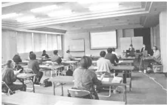
皆さん真剣な眼差しです！