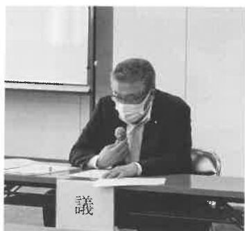
議事の進行をする中原会頭

第1号 定款変更について 第2号 令和3年度補正予算(第1号)の承認について 第3号 令和2年度事業報告並びに収支決算報告の承認について 第4号 常議員の再選任について