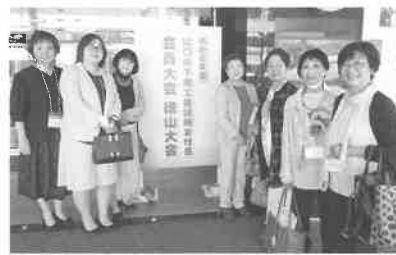
徳山大会に来ました！