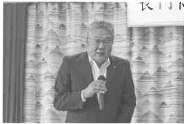
あいさつをする中原会頭