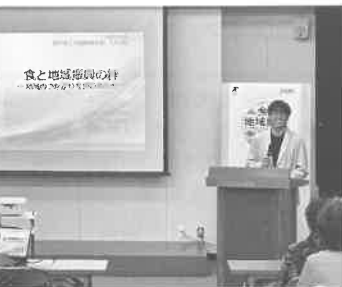
青年部OBによる講演会

担当委員会としては普段の例会より調整など大変でしたが、青年部、女性会双方に実りのある例会を準備できたのでよかったです。