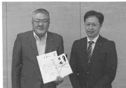
中原会頭とユーズ協会

長門商工会議所では、今後も山陰道の早期実現に向けて陳情活動等を行ってまいります。また、今年度創立70周年を迎えます。会報にも記載しておりますが記念式典や記念イベント、交流会も行いますので是非ご参加ください。(K・K)