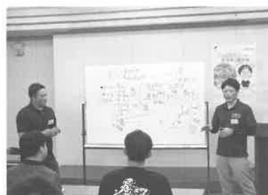
食生活を見直す機会に

変わりました。変わりゆく時代の中、生きていくために欠かせない「食」。本当に大切なものは何かに気づくことができれば、今後の食に対する向き合い方が変わるはず。働き盛りの世代が中心の青年部なので皆さん健康には気を使っているとは思いますが、この講義を機に食にも関心を深め、終了後もいくつも質問