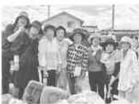
綺麗になりました

7月7日(日)海岸清掃が今年も各地域でありました。さわやか海岸は曇り空で風もあり、まずまずのお天気でした。女性会より8名参加。ごみの量は11か所まで4985kg(可燃ごみ4700kg不燃ごみ285kg)だとのこと。大きな物は流木や漁具等ありましたが、我々はおっぱら草取りです。学生さん・市の職員さん等みなさんで作業し、夏の海辺の景観が少しでも良くなるお手伝いが出来たようで良かったです。