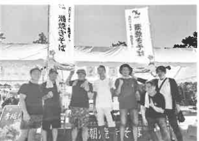
青年部が長門市をPR

当日参加した会員達も本業とは違う屋台での作業に大変さを忘れ笑顔で過ごしていた姿を見て、仲間でこういうことが出来る青年部の良さを再