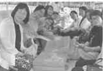
遊覧船で他の女性会の方々と