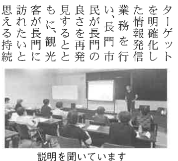
説明を聞いています

会員の皆さま方や関連諸団体(現在241事業者と協同しながら、明確なコンセプトに基づいた観光地域づくりを実現するための戦略を策定し、『ながとブランドの創造』に向け事業の推進や、データをきちんと管理し、