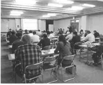
とても大切な話が聞けました！

10月14日(火)、当所3階にて、標記講話会が開催され、女性会より9名が参加しました。 まず自衛隊は、24時間365日日本の平和と安全を守る為に存在しているということ。 私の中では、自衛隊といえど、すぐに頭に浮かぶのは、災害派遣時の様子です。 報道媒体によって、伝えら