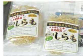
「長門仙崎産しらも、剣先イカ塩うに(塩辛)」

まだあまり知られていない「しらも」と言われる海藻を世の中に広げていきたいという想いから作られた商品です。また、仙崎剣先イカ×黒うにの濃厚塩辛は、職人の手仕事による絶妙な塩加減と黒うにの濃厚なコク、イカの甘みがひと口で広がります。