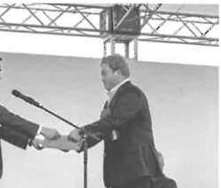
今まで携わった方々の協力の成果

昨年度のちびなが実行委員長でしたので、連合会メンバーを代表して受け取りに行きましたが、先輩方がスタートして試