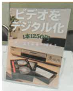
「ビデオテープをデジタル化サービス」

昔の思い出を記録したVHSなどの記録媒体。「見られない」から最短即日「見られる」に変える、安心のサービスです。デジタル化することで、いつでもどこでも誰とでも見られます。1本から受付可能なのでお手軽に依頼できます。