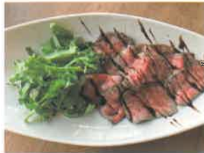
「長州ながと和牛ローストビーフ」

年間を通じて温暖な長門地域で育ち、鮮やかな赤身と芸術的な霜降りが魅力のながとが誇るブランド和牛を、こだわりの調理法でローストビーフにした商品です。