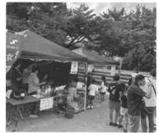
沢山の子供たちが来てくれました