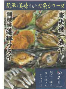
「簡単・美味しいお魚シリーズ」

余計な味付けを廃し、魚本来が持つ「旨み」とミネラルたっぷりの海の香り、そして地の海水で作った塩が重なりあった魅力ある商品です。どの商品も電子レンジなどで温めるだけで食べられる簡単調理シリーズです。