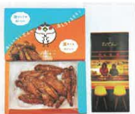
「冷えちよるチキン、チキンチキンごぼう(冷蔵・冷凍)」

長州どりの手羽中から揚げを簡単おかず仕上げました。自然解凍で冷たいままでも、レンジでチンして温かくしても、開けたらすぐ食べられるラクちゃんおかずです。学校給食で人気のチキンチキンごぼうも家庭で簡単に食べられます。