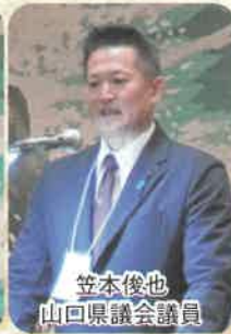
笠本俊也 山口県議會議員