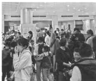
今年度も大盛況でした。