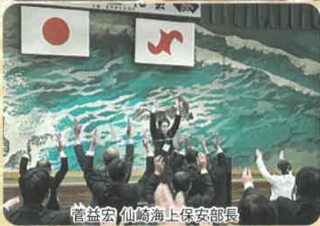
菅益宏 仙崎海上保安部長