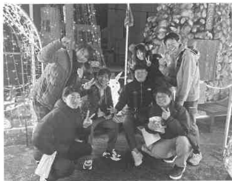
次年度の交流会をお楽しみに

が、一緒に回った他のメンバーのおかげで、1ホール楽しく回り切る事ができました。オートレース観戦の方は、会場でのスマホの使用ができないとのことでしたが、参加した川崎監督からは「券は全然当たらないが、森且行選手がカットコよくてメロメロだった