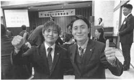
有意義な交流会でした。