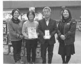
地域の子どものために。

1月27日(火)、長門市立図書館に地域貢献事業として女性会からの寄付を館長に手渡しました。